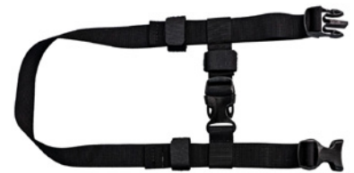
フロント取り付け用ストラップ *